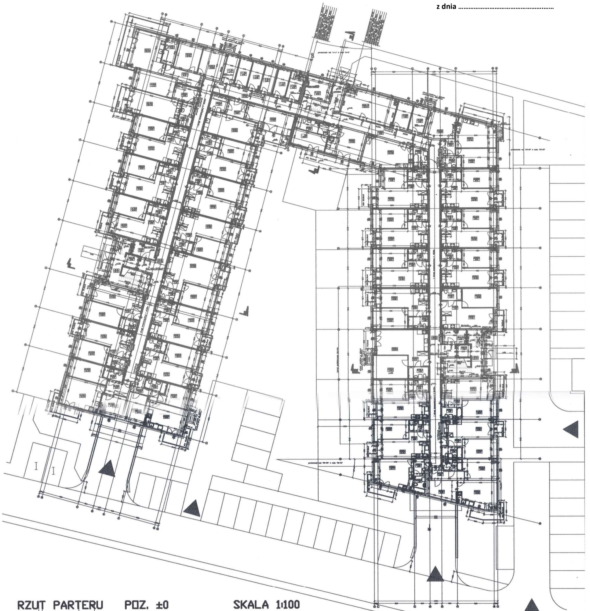
RZUT PARTERU POZ. ±0