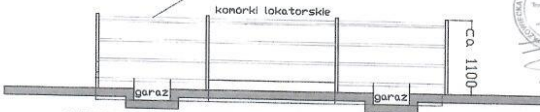
SCHEMAT PRZEKROJU POPRZECZNEGO

dach pograżony ca 40cm płaski pokryty papą