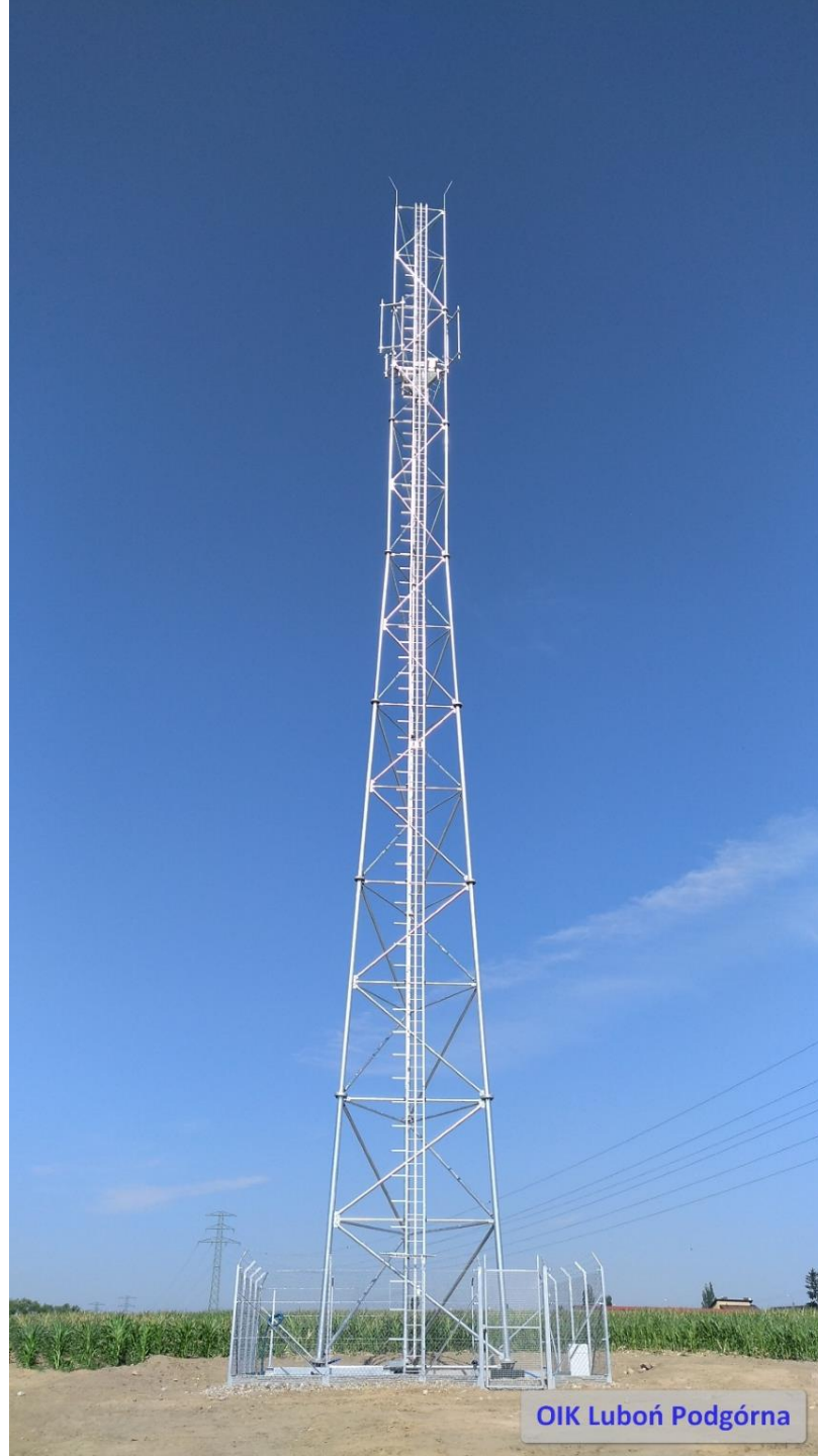
OIK Luboń Podgórna